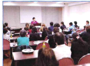
第49期(今期)特別講座講義風景