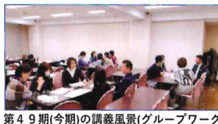
第49期(今期)の講義風景(グループワーク)