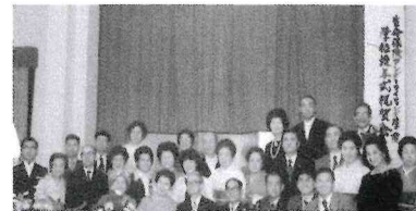
第1期生の卒業式 (生命保険修士学位授与式)

1975年第一期生が卒業。 卒業生(生命保険修士)による 「生命保険修士会」発足