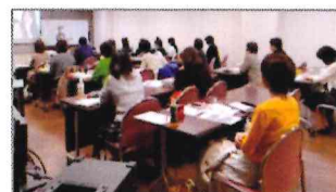
第49期(今期)の講義風景