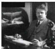
ソロモン・スティーブン・ヒュー 1986年当時のアメリカン・カレッジ ブナー博士

ソロモン・スティーブン・ヒューブナー (1882年3月6日、ウィスコンシン州マニト ワック - 1964年7月17日、ペンシルベニア州メリオン) は、ペンシルベニア大学ウォ ートン・スクールの保険学名誉教授でした。彼は「保険教育の父」と広く知られており、 「人間生命価値」の概念を生み出し、これが保険価値と必要性の計算の標準的な方法と なりました。