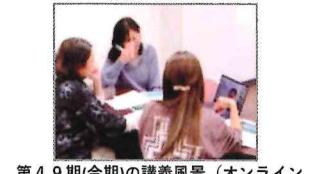
第49期(今期)の講義風景 (オンライン 受講生とグループワーク)